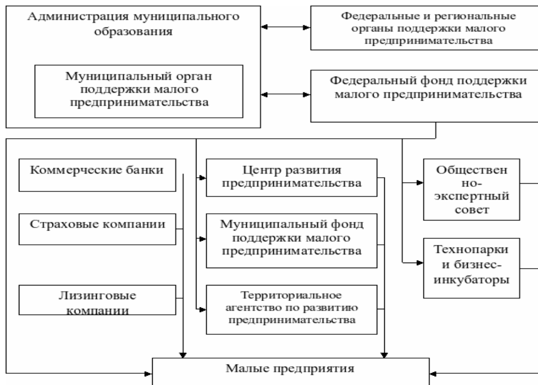
Рис. 5. Примерная схема организационной инфраструктуры поддержки малого и среднего предпринимательства на местном уровне. [3]

В приложении 1 приведены основные типы инфраструктур по поддержке и развитию малого и среднего предпринимательства.