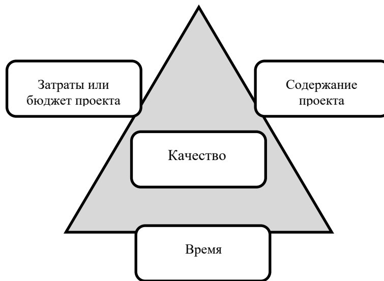
Рисунок 1 – Треугольник управления проектами [3, с.9]

Так в работе Д.С. Глотова и А.Н. Соломахина авторы предлагают считать организацию работы органов местного самоуправления (ОМСУ) на основе управления проектами абсолютной новеллой в их деятельности, что требует определения основных понятий и сущности базовых подходов, связанных с проектным управлением [3, с.8]. Для наглядности предлагается оперировать методологией «тройственной ограниченности», описывающей баланс между содержанием проекта, затратами и временем (рисунок 1).