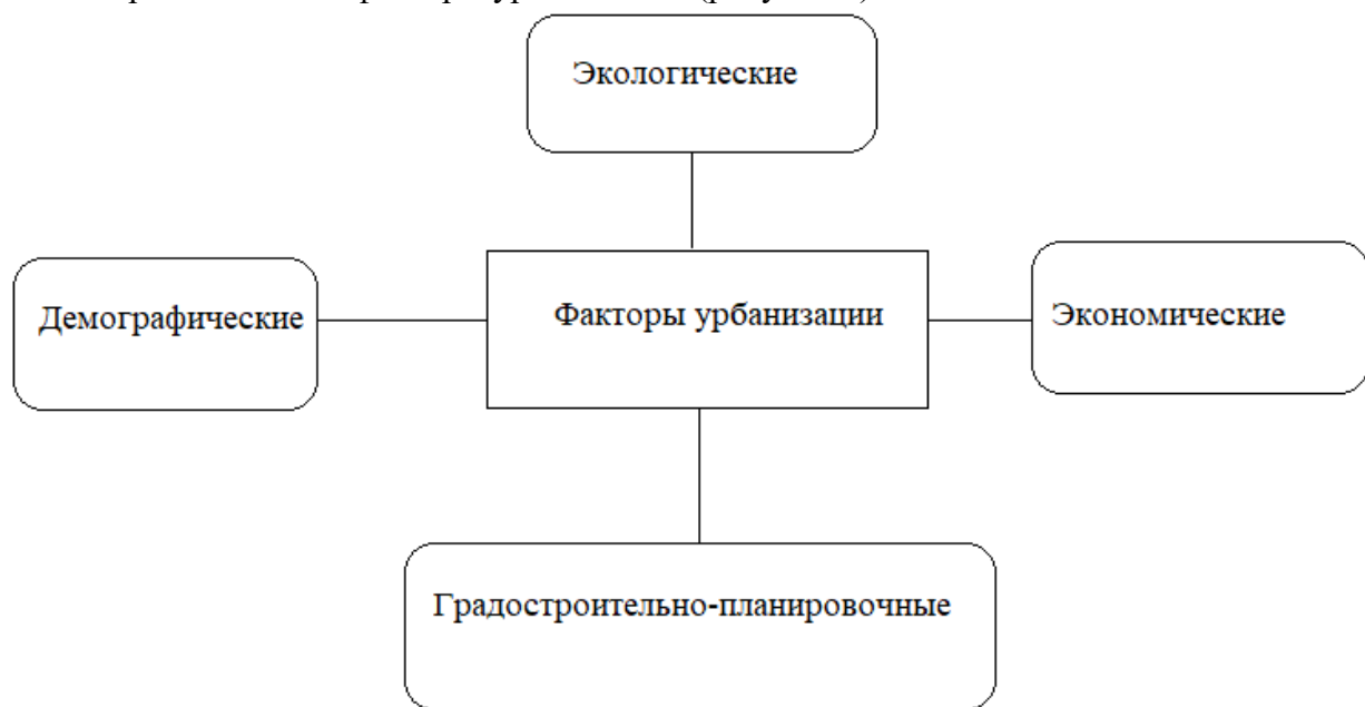
Рисунок 1 – Факторы урбанизации

Рассмотрим основные факторы урбанизации (рисунок 1).