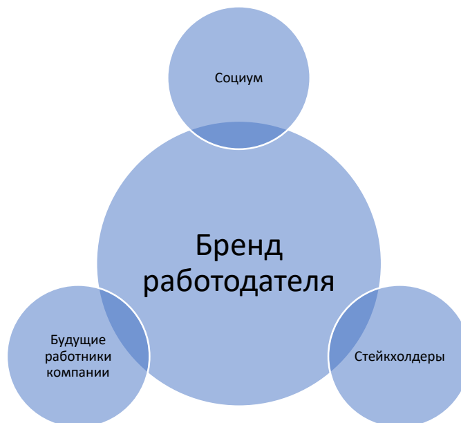
Рисунок 1. – Субъекты взаимодействия с брендом работодателя (разработано авторами)

Хорошо продуманная стратегия брендинга работодателя может помочь любому бизнесу повлиять на точки соприкосновения с ключевыми стейкхолдерами.